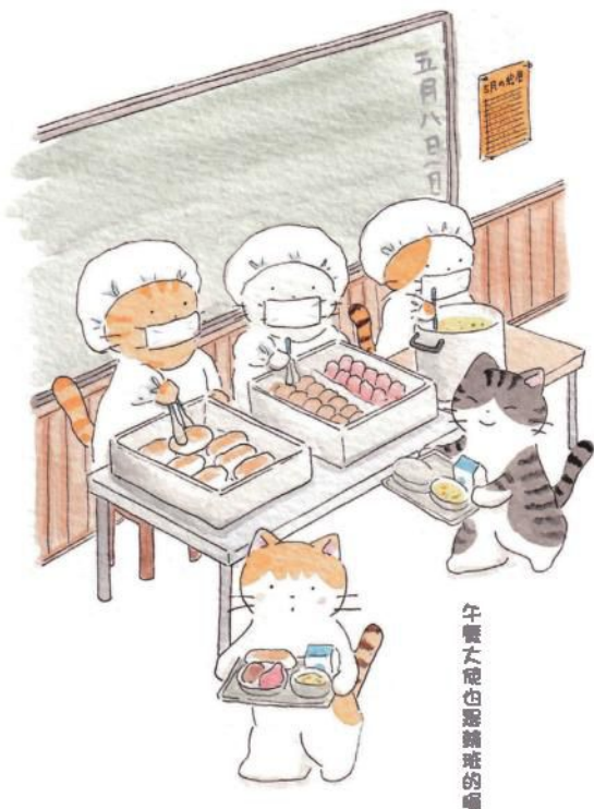
午餐大使也踴躍班的囉

午餐大使每次去配餐室之前，一定要穿上白袍、手洗乾淨後，再去領取每班的午餐。然後把餐點運到自己的教室，再分配給全班同學。用餐後，還要收拾乾淨、把餐具運回配餐室，才算工作完成。但細節上，每家學校多少也有點不同。