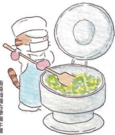
廚房內備在準備午餐

午餐大使是從每個班級選拔出來的，之後會再根據班級的情況，每週或每月重選一次。基本上，學生自己處理學校的生活瑣事是很普遍的事情。除了午餐大使，